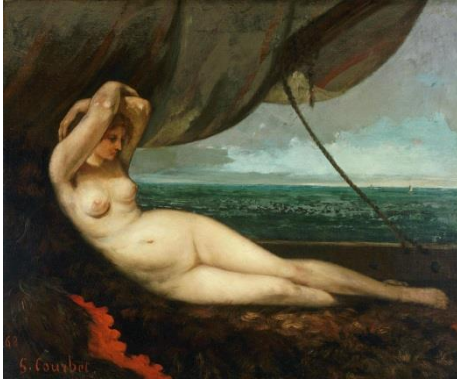
Gustave Courbet, Nude reclining by the Sea, 1868

Dit schilderij vertelt het verhaal van de Sjoa en de vernietiging van schoonheid en van alles wat waarde heeft. En van de kracht van minderheden die opkomen voor menselijke waarden en rechten. Daar kwam ik pas achter toen ik de toelichting las.