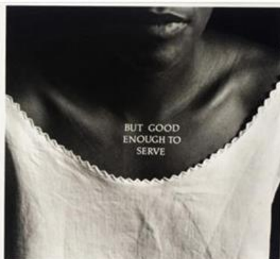
Lorna Simpson (1960), C-Ration

Ik liep er bijna aan voorbij, maar ik werd terug getrokken door deze foto. Lorna Simpson is een Afro-Amerikaanse kunstenaar, die in haar werk ras en gender bestudeert, vooral met een nadruk op