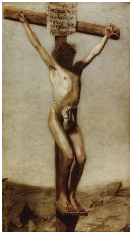
Thomas Eakins (1844-1916), Crucifixion