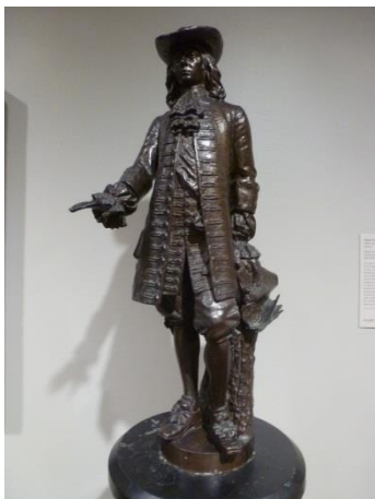
Alexander Milne Calder (1846-1923), Model for the Statue of William Penn, 1889, after 1886 original

De laatste vrije dag bracht ik grotendeels door in het Museum of Art, een geweldig rijk museum met middeleeuwse en moderne kunst uit Europa, en kunst uit Amerika. De indrukken van de conferentie nog vers met me meedragend, bekeek ik sommige werken met bijzondere aandacht. Ik selecteer er een paar.